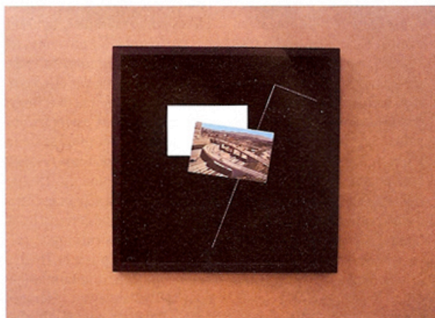
Mark Geffriaud, Si l'on pouvait être un Peau-Rouge / looking forward , 2009, cadre (39 x 39 cm), carte postale, marie-louise, découpe dans panneau de bois (250 x 200 x 5 cm), détail de l'installation à gb agency, Paris.

MARK GEFFRIAUD, SI L'ON POUVAIT ÊTRE UN PEAU-ROUGE , jusqu'au 7 mars, gb agency, 20, rue Louise Weiss, 75013 Paris, Tél. 01 53 79 07 13, www.gbagency.fr , t/lj sauf dimanche lundi 11h-19h.