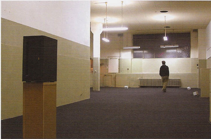
fig. 1 Dominique Petitgand À l'étouffée , 1996/2002

Le processus de la mémoire a plusieurs affinités avec la manière dont les œuvres sonores de Dominique Petitgand engendrent des atmosphères narratives sans être nécessairement narratives elles-mêmes. Ces œuvres racontent des histoires, mais des histoires si discontinues, fragmentées et morcelées qu'elles sont près